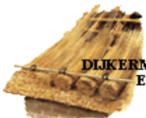
DIJKERMAN RIETDEKKERS Eefde - Gorssel